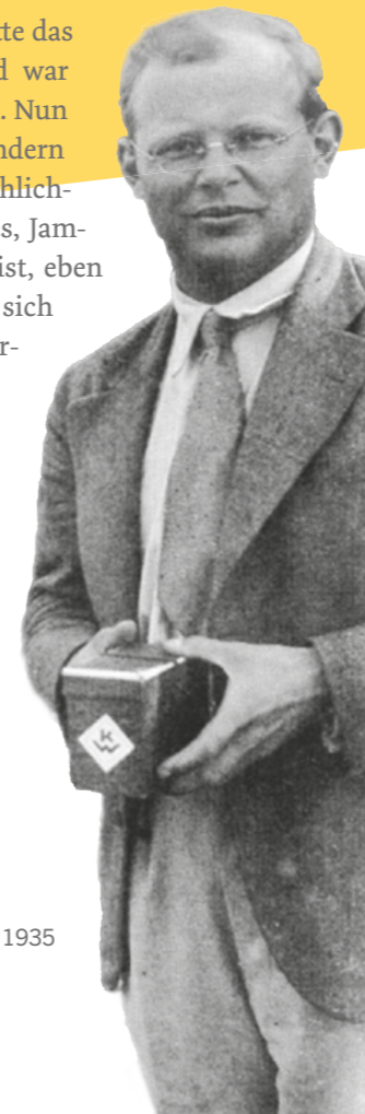
Dietrich Bonhoeffer, 1935

Wer wird Weihnachten recht feiern? Wer alle Gewalt, alle Ehre, alles Ansehen, alle Eitelkeit, allen Hochmut, alle Eigenwilligkeit endlich niederlegt an der Krippe.